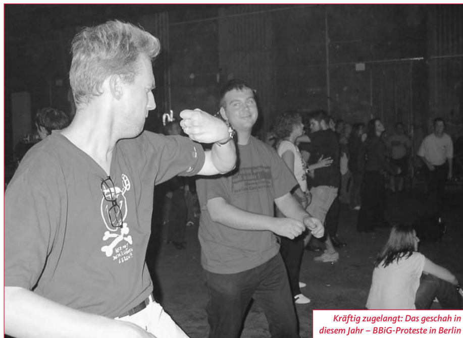
Kräftig zugelangt: Das geschah in diesem Jahr – BBiG-Proteste in Berlin

□ Im Herbst (1. Oktober bis 31. November) finden die turnusgemäßen Wahlen nach