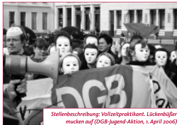
Stellenbeschreibung: Vollzeitpraktikant. Lückenbüsser mucken auf (DGB-Jugend-Aktion, 1. April 2006)

dass immer mehr Menschen in »Nicht-Norm-Arbeitsverhältnissen« und damit potenziell prekär arbeiten. Zwischen 1991 und 2005 sind in Deutschland über sechs Millionen Vollzeitstellen verlorengegangen – viele dieser Vollzeitstellen wurden in sozialversicherungsfreie Teilzeittellen umgewandelt oder outgesourct. Darum sind gleichzeitig die Anteile geringfügiger Beschäftigung und Selbstständigkeit deutlich gestiegen. Besonders häufig sind Frauen und junge Menschen von