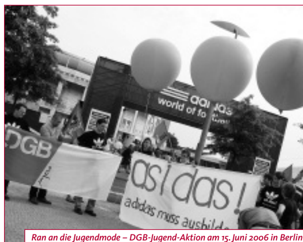
Ran an die Jugendmode – DGB-Jugend-Aktion am 15. Juni 2006 in Berlin

Sehbrock kommentiert: »Der erste Skandal: Die Ausbildungsquote, die Adidas zu bieten hat. Der zweite Skandal ist: Traineeprogramme und Praktikanten wer-