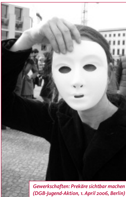
Gewerkschaften: Prekäre sichtbar machen (DGB-Jugend-Aktion, 1. April 2006, Berlin)

Deshalb liegt die Zukunft der gewerkschaftlichen Arbeit darin, sich sowohl um die klassische Klientel als auch um die neu-