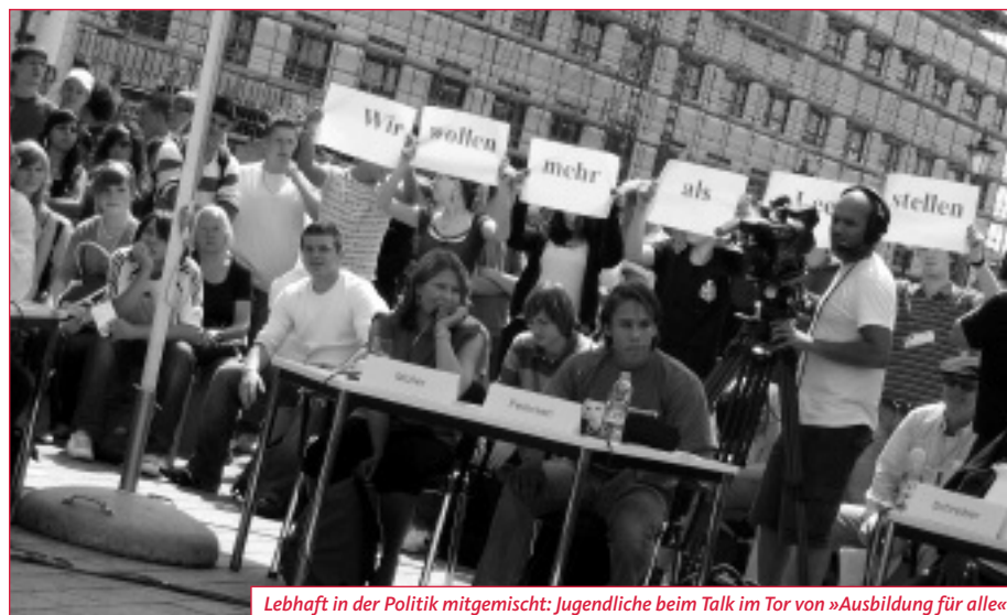
Lebhaft in der Politik mitgemischt: Jugendliche beim Talk im Tor von »Ausbildung für alle«