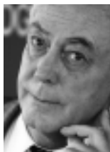
Dieter Schulte, DGB-Vorstandsvorsitzender

■ Erstens: Die Mehrheit der Jugendbildungsreferenten ist nur für zwei Jahre beschäftigt. Dieses werden wir ändern: Der Geschäftsführende Bundesvorstand schlägt vor, die Verträge dieser Jugendbildungsreferenten auf fünf Jahre zu verlängern. Zweitens: Die Jugendbildungsstätten in Hattingen und in Oberursel bleiben erhalten. Drittens: Die Gewerkschaftsjugend erhält die Mittel, die sie für ihre Arbeit braucht. Dazu gehören auch Mittel für ein neues Kommunikationsmedium. Ihr – die Gewerkschaftsjugend –, ihr seid der DGB des 21. Jahrhunderts.