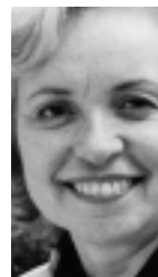
Maria Böhmer, stellvertretende Vorsitzende der CDU/CSU-Fraktion des Deutschen Bundestages

■ Angesichts der Vielfalt des von Ihnen Unternommenen erweist sich die pauschale Klage von der unpolitischen Jugend als unzutreffend. Politik kritisch zu begleiten ist eine verantwortungsvolle Aufgabe.