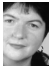
Maritta Böttcher, Bildungs- und hochschulpolitische Sprecherin der PDS-Bundestagsfraktion

■ Die Wirtschaft zieht sich weiter aus der Ausbildungsverantwortung zurück und das duale System weicht zunehmend einem Maßnahmedschungel, der von niemandem mehr überblickt werden kann. Jetzt wäre es Zeit für die Bundesregierung, auf ihre im Koalitionsvertrag angekündigten gesetzgeberischen Maßnahmen zur Sicherung einer qualifizierten Ausbildung für alle Jugendlichen zurückzukommen. Die Vorschläge für eine Reform des Berufsbildungsgesetzes von der GEW und ver.di finden unsere volle Unterstützung. Auch die Umlagefinanzierung ist nach wie vor aktuell.