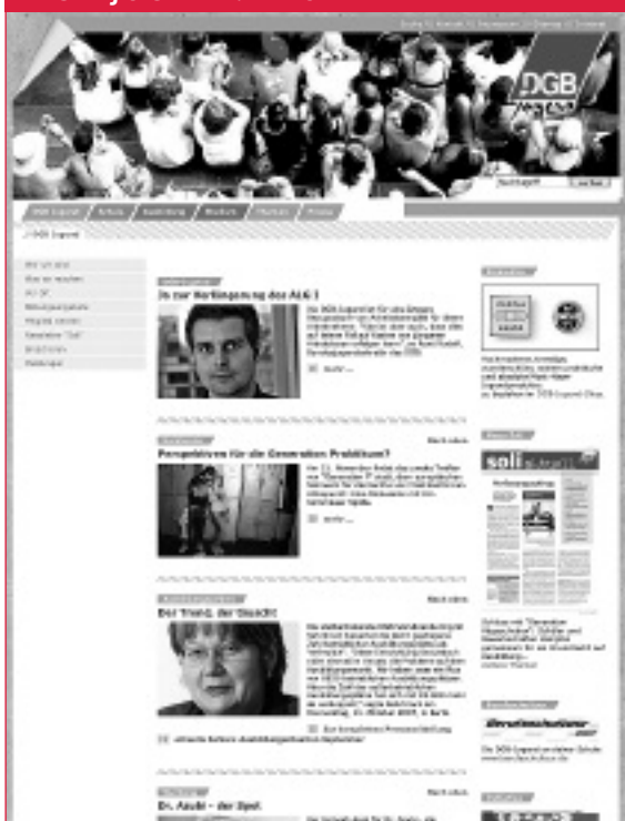
Der neue Webauftritt der DGB-Jugend, von »Students at work« und »Dr. Azubi« ist online! Schöner, bunter und schneller. Reinschauen und durchklicken auf: www.dgb-jugend.de