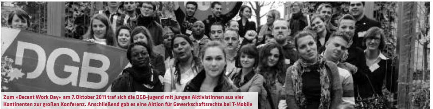
Zum »Decent Work Day« am 7. Oktober 2011 traf sich die DGB-Jugend mit jungen AktivistInnen aus vier Kontinenten zur großen Konferenz. Anschließend gab es eine Aktion für Gewerkschaftsrechte bei T-Mobile

Für konkrete Aktionsformen bezieht sich die DGB-Jugend auf die erfolgreiche Strategie der letzten Male – und betrachtet Massenblockaden ausdrücklich als legitimes und zivilgesellschaftlichem Handeln. Die Grundlage für den Erfolg des Bündnisses in den vorangegangenen Jahren sei jener Konsens gewesen, »der Massenblockaden als Aktionsform des zivilen Ungehorsams festschrieb und der von allen Gruppen und Organisationen mitgetragen wurde – und das Bekenntnis, dass von dem Bündnis keinerlei Eskalation ausgeht«. Die Aktivitäten richten sich ausdrücklich nicht gegen die KollegInnen von der Polizei. ▀