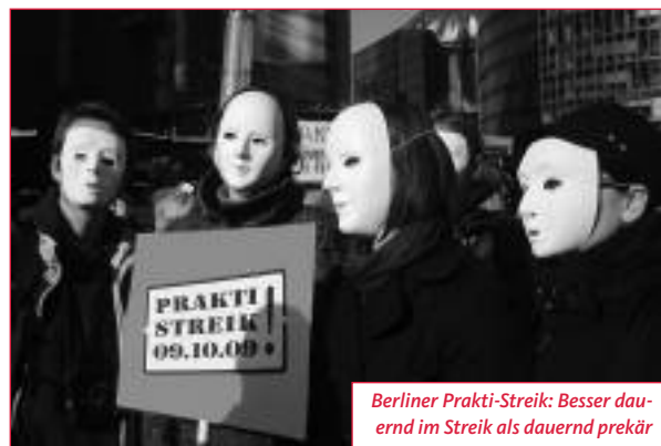
Berliner Prakti-Streik: Besser dauernd im Streik als dauernd prekär

Dort verlieh die DGB-Jugend gemeinsam mit Fairwork e.V. bereits zum dritten