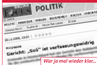
War ja mal wieder klar...

+ Ausbildung 2009: Das Verzeichnis »Die anerkannten Ausbildungsberufe 2009« dokumentiert die Arbeiten zur Ordnung der beruflichen Bildung und enthält alle anerkannten Ausbildungsberufe.