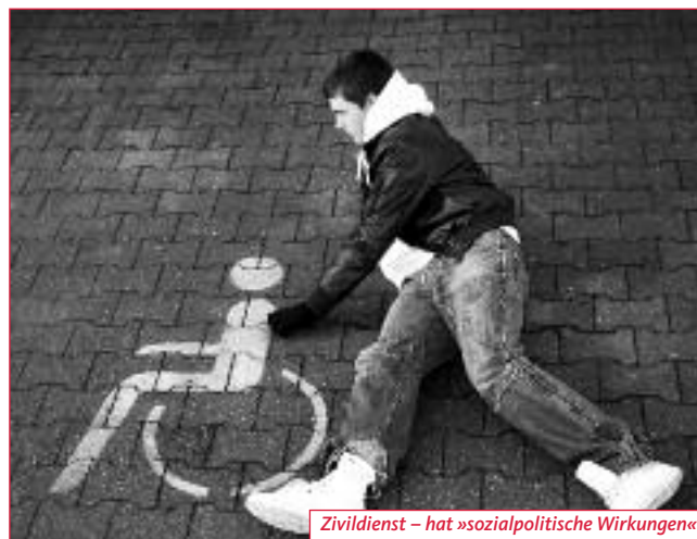
Zivildienst – hat »sozialpolitische Wirkungen«

Eine Position , wie sie im Bundestag auch von den Oppositionsparteien vertreten wird: »Anstatt vier Jahre mit einer Verkürzung zu verschwenden, muss der endgültige Ausstieg aus den Pflichtdiensten organisiert werden«, fordern Bündnis 90/Die Grü-