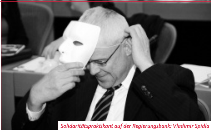
Solidaritätspraktikant auf der Regierungsbank: Vladimír Spidla