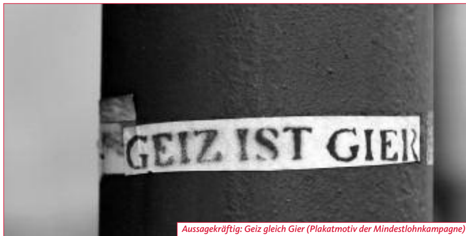
Aussagekräftig: Geiz gleich Gier (Plakatsmotiv der Mindestlohnkampagne)

Die Gewerkschaften starteten schon erste Versuche, Beschäftigte in atypischen und prekären Beschäftigungsverhältnissen zu organisieren: die IGM-Vernetzungsplattform »ZOOM« für LeiharbeiterInnen, die Lidl-Kampagne von ver.di oder die Mindestlohn-